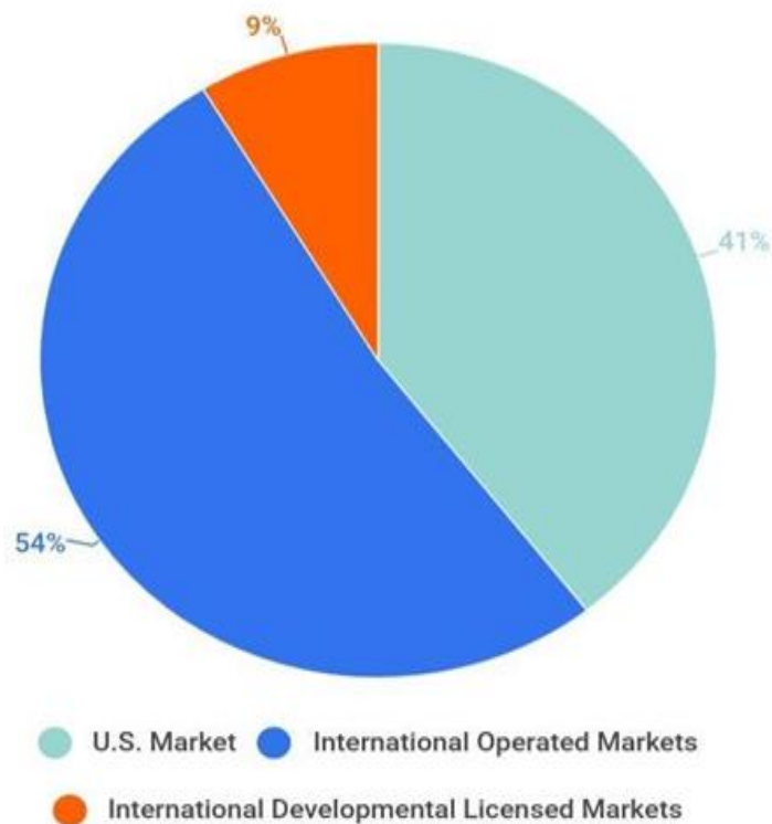
Рисунок 2.2 Розподіл доходу компанії McDonald's у 2023 році, у %

Джерело: розроблено автором на основі джерела [29]