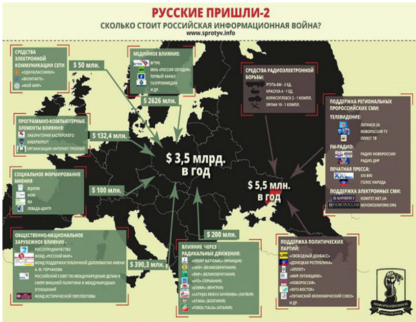
Рис. 1. Щорічні витрати Росії на інформаційну війну проти України

За підрахунками експерта з інформаційної безпеки групи В'ячеслава Гусарова, Російська Федерація щорічно витрачає на інформаційну війну проти України не менше 3,5 млрд дол. США (рис.1).