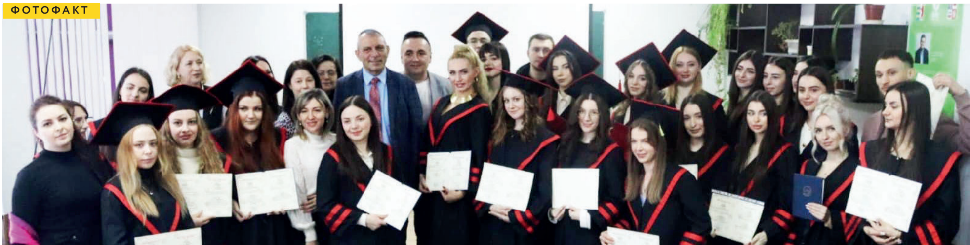
В УжНУ – чергові поповнення магістрів. Зокрема, випускники отримали дипломи на філологічному факультеті