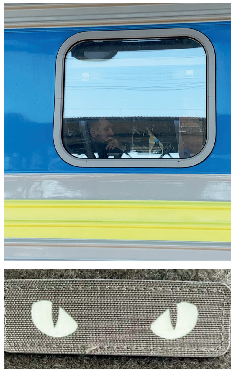
Попереду – 500 кроків додому, а з ними – ще тисяча кілометрів від...

Поїзд рушає, і ми чекаємо, доки проїде останній вагон. Я ще раз обертаюся, спускаючись до підземного переходу: сонячне проміння фарбує залізничні колії. Прощання з об'їзною зустрітись знову.