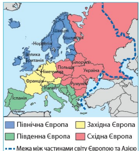
Субрегіони Європи (за геосхемою ООН)

Зокрема, студенти повинні чітко класифікувати наступні етноси: поляки; чехи; серби; хорвати; боснійці; італійці; валлони; французи; румуни; греки; вірмени; ірландці; німці; фламандці; шотландці; албанці; євреї; араби; перси (іранці); роми (цигани); грузини; чеченці; осетини; абхази; кримські татари; гагаузи; караїми; китайці; японці; баски.