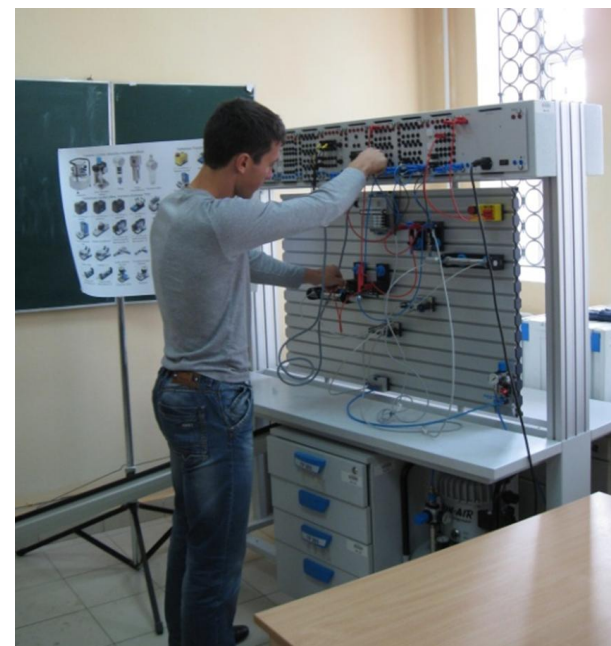
Заняття в лабораторії з пневмоавтоматики та датчиків.

Створено три комп'ютерні класи, які підключені до Інтернет, бібліотечний відділ з хорошим довідково-методичним забезпеченням.