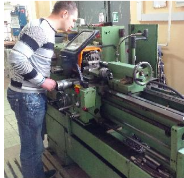
В навчально-виробничій майстерні

– достатнє навчально-методичне забезпечення, – функціонують навчальні і наукові лабораторії, оснащені сучасним обладнанням.