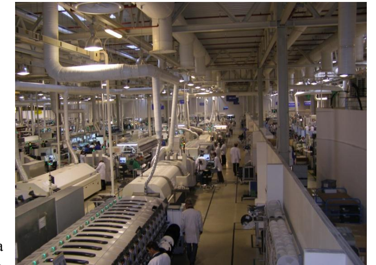
Проходження практики на заводі

підприємствами, умовами праці на них. З іншого боку роботодавці, в свою чергу мають можливість оцінити фаховий рівень студентів, ставлення до роботи, що в певній мірі і визначає перспективу працевлаштування. Частина випускників ІТФ працевлаштовуються ще будучи студентами і працюють за графіком, погодженим деканатом і підприємством.