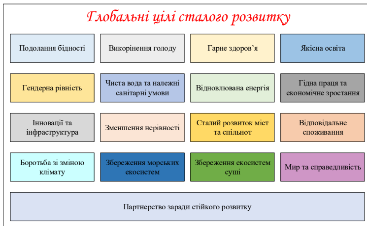
Рис. 1. Глобальні цілі сталого розвитку

Національну доповідь «Цілі сталого розвитку: Україна», у якій були визначені базові показники для досягнення поставлених цілей з урахуванням специфіки національного розвитку 1 .