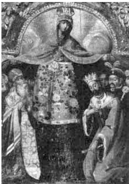
А. Б. Хмельницького

Портрет якого гетьмана є елементом композиції зображеної ікони?