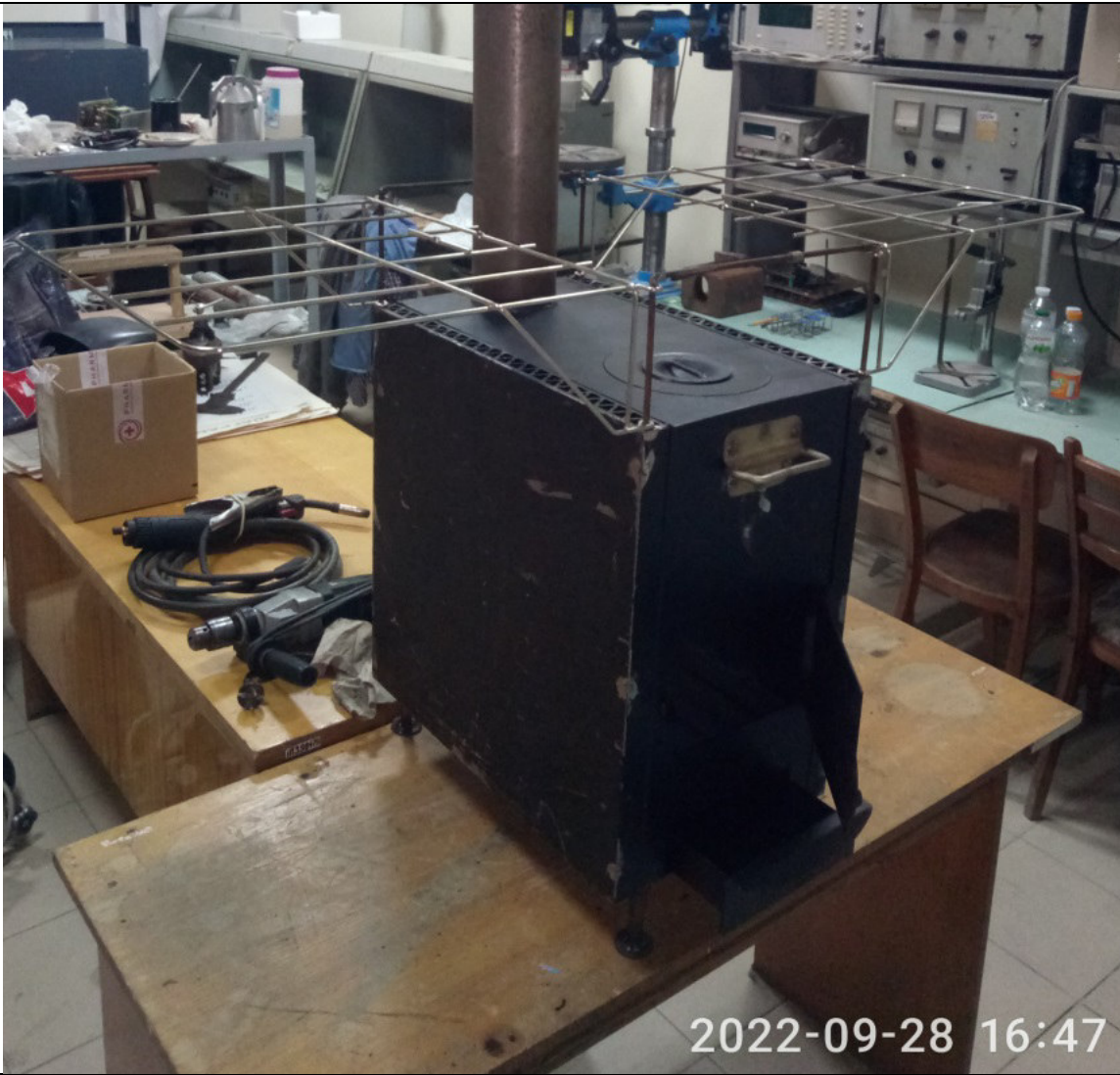
Дооснащення печі обігріву сушкою для одягу.