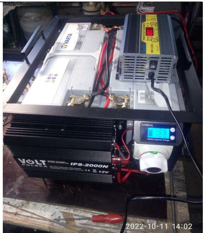
Потужні джерела безперебійного живлення на основі свинцевих акумуляторних батарей