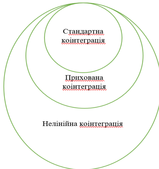
Рис. 1. «Ієрархія» коінтеграції

Проведене дослідження дозволило встановити "ієрархію" явища коінтеграції: стандартна коінтеграція виступає окремим випадком прихованої коінтеграції, тоді як прихована коінтеграція є простим прикладом нелінійної коінтеграції (рис. 1).