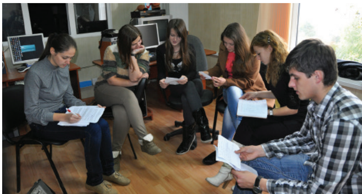
Студенти 2 курсу готують радіовипуск