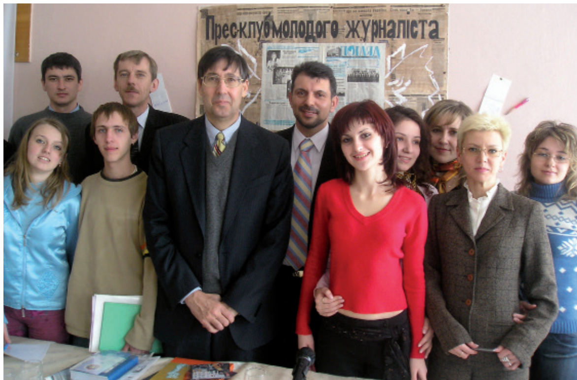
Із послом США Джоном Гербстом

С туденти відділення журналістики УжНУ мають добру базу для того, щоб стати хорошими спеціалістами в галузі теле- і радіожурналістики. При кафедрі діє сучасний телерадіоцентр, де майбутні медійники мають можливість провадити повний цикл виготовлення радіопрограм і телевізійної продукції, готувати матеріали для друкованих ЗМІ й інтернет-видань.