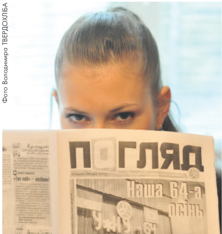
Кожен повинен мати «Погляд»!