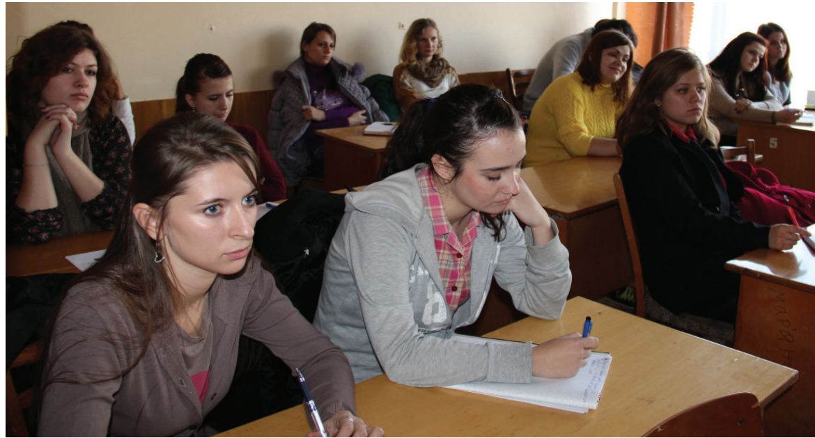
Науковий семінар з участю студентів

Якщо виходити з того, що Університет шукає істину з допомогою науки, то дослідження є його основним завданням. Карл ЯСПЕРС