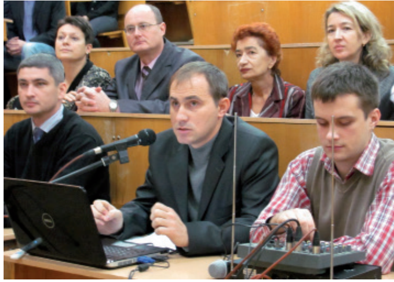
Під час презентації сайту відділення журналістики Ужгородського національного університету

Потреба у своєму ресурсі на просторах Усесвітнього павутиння актуалізувалася для нашої кафедри 2008 року, коли в навчальних планах підготовки фахівців медіасфери з'явилася дисципліна «Інтернет-журналістика». Хоч сама ідея, ясна річ, народилася ще раніше. Відтак на одному з безплатних хостингів було створено перший онлайн-експериментальний майданчик для практикування майбутніх веб-журналістів. Щоправда, проіснував він усього кілька місяців і був закритий через невідвідуваність. Ресурс, який нині зветься сайтом відділення журналісти-