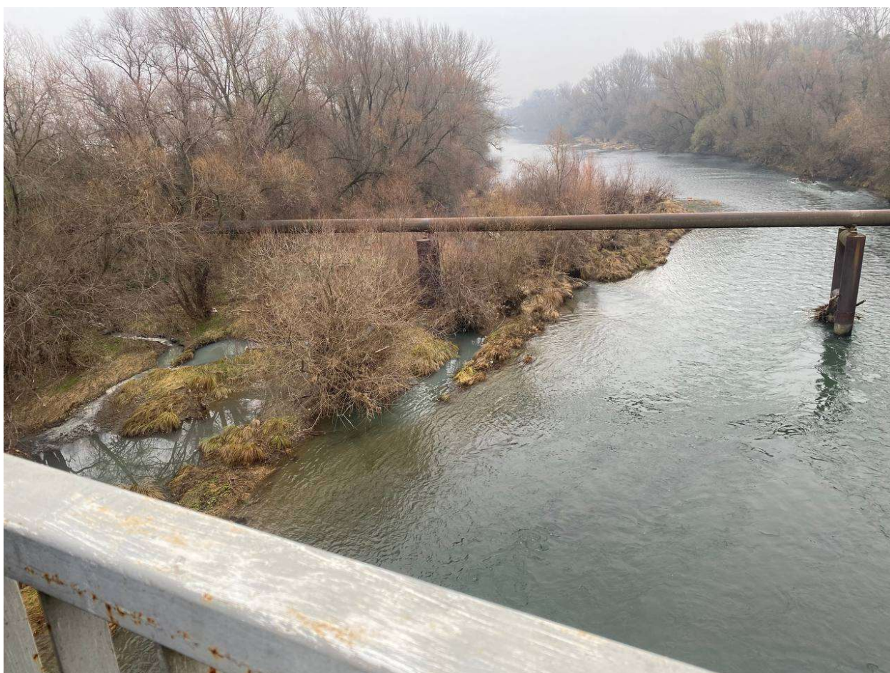
Рис. 3.1.2 Рідкі відходи у річку Уж біля транспортного мосту по вулиці Баб'яка.

Аналізуючи Рис. 3.1.1 легко можна відмітити, що торговий центр знаходиться безпосередньо на березі річки Уж і, тим самим, становить загрозу екологічному стану водотоку. Рідкі та тверді відходи, що утворюються в результаті діяльності торгової мережі можуть негативно впливати на гідрохімічний та гідрологічний режим досліджуваного водного об'єкту, який далі впадає в річку Ліборець на території Словаччини спричиняючи сусідній країні, при цьому, транскордонне забруднення водних систем. На власно зробленому фото (Рис. 3.1.2.) продемонстровано скид рідких відходів у русло р. Уж.