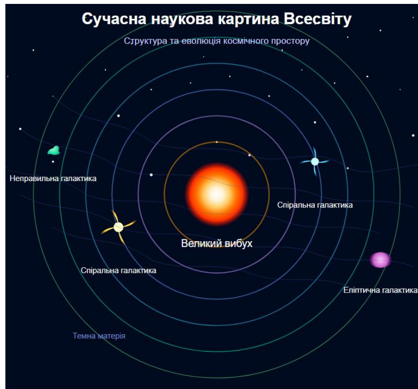
Рис. 4.1. Сучасна наукова картина Всесвіту

утворюючи волокнисту структуру Всесвіту. Наше Сонце належить до спіральної галактики Чумацький Шлях, яка входить до Місцевої групи галактик, що є частиною надскоупчення Ланіакєя.