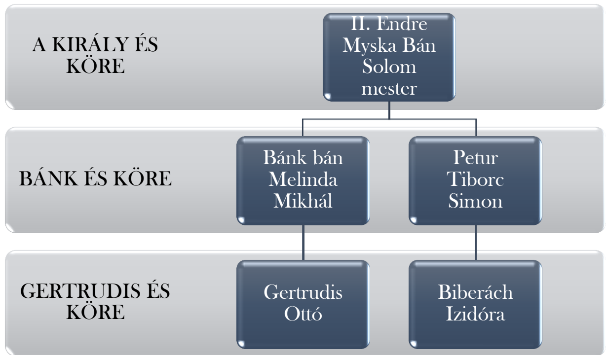
Ábra 3. A Bánk bán hierarchia

A darab fő cselekménye a politikai intrikákkal és szerelemmel átszótt tragédia. Bánk, a főhős, a nép vezére, aki az elnyomottakat képviseli, de politikai szövetségeseket is keres. A király, Ottó, és környezete feszültséget okoznak Bánk és köre között. A szerelmi szálak és az árulások bonyolult hálóját vezet a drámai befejezéshez. Figyeljük meg, ki milyen szerepet foglal el: