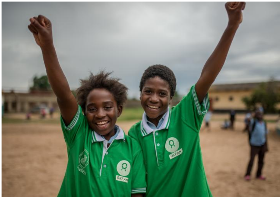
Рис. 2.1.

З рисунку 2.1. можна простежити сутність основного гасла організації. “Наше бачення — це справедливий і стійкий світ. Світ, у якому люди та планета знаходяться в центрі справедливої економіки. Світ, у якому жінки та дівчата живуть вільними від гендерного насильства та дискримінації. Там, де кліматичну кризу стримано, а інклюзивні та підзвітні системи управління дозволяють притягнути до відповідальності тих, хто перебуває при владі” [30].