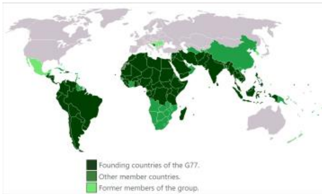
Рис. 2.1 Країни, що входять до складу Групи 77

Офіційне заснування групи відбулося 15 червня 1964 року під час Першої конференції ООН з торгівлі та розвитку (UNCTAD) у Женеві. На конференції представники 77 країн підписали декларацію про створення цієї групи. Об'єднання стало важливою платформою для обговорення спільних інтересів та проблем, що стосуються країн, що розвиваються. Вона забезпечила механізм для координації дій, обміну інформацією та спільних зусиль у веденні переговорів на міжнародному рівні (див рис. 2.1) [2].