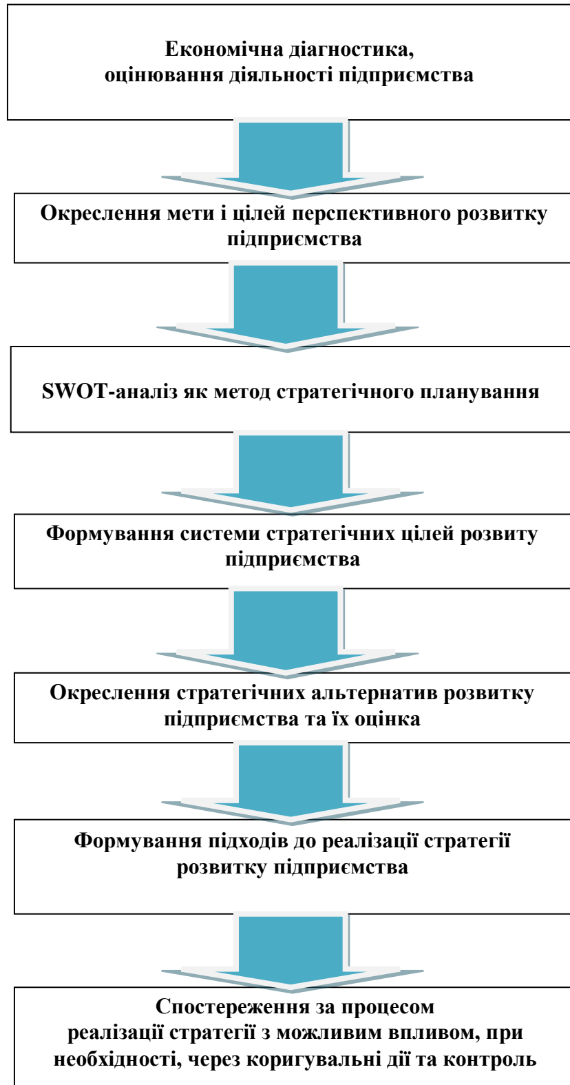
Рис. 3.1. Алгоритм побудови процесу забезпечення перспектив стратегічного розвитку лісомисливського господарства ДП „Довжанське ЛМГ”**

*Сформовано на основі джерела і доповнено автором: [37].