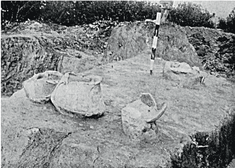
Куштановицький могильник. Курган № 5. Розкопки Й.Янковича та Я. Бема