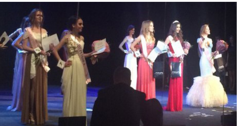
Такі красуні стають справжніми лікарями