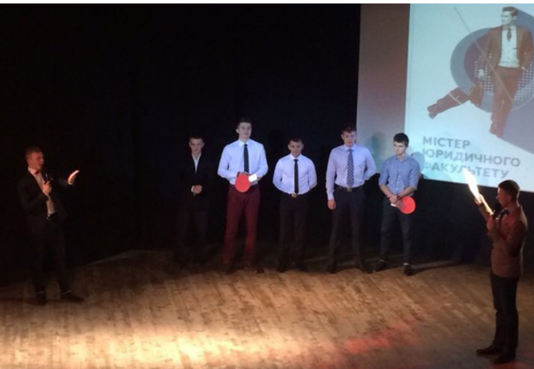
А юристи змагалися за титул Містера факультету

Головний редактор В.Ю.ТАРАСЮК. Верстка: В.В.ЗЕНИНЕЦЬ. Набір: М.Б.ГАРАЗДІЙ. Коректура: А.В.МАЛАХОВА.