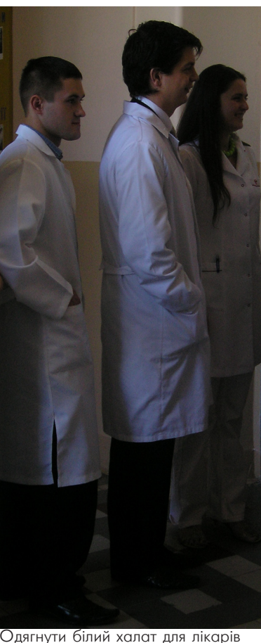
Одягнути білий халат для лікарів означає служити людям