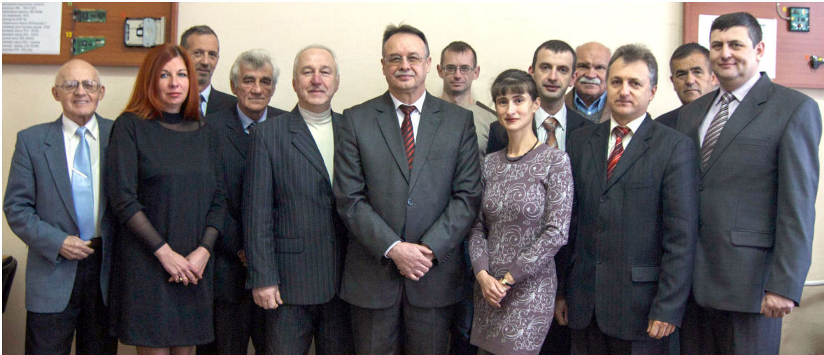
Коллектив кафедри в повному складі

Яскравою, багатогранною, перспективною й продуктивною є частинка фізичного факультету — кафедра прикладної фізики, яка на свій, здавалося б, молодий вік стрімко розвивається та з великим ентузіазмом виховує нових фахівців.