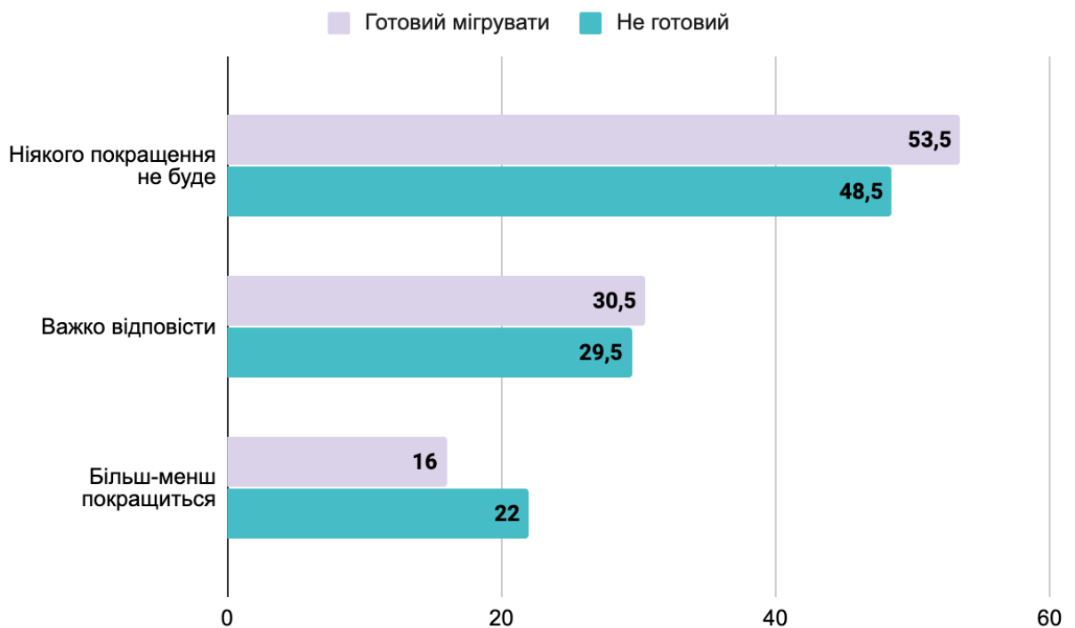
Рис. 3.2. Розподіл потенційних мігрантів за баченням перспектив розвитку країни, %, 2017 р. [46]

імігрантів – це ті, хто чітко усвідомлює сучасний стан суспільства.