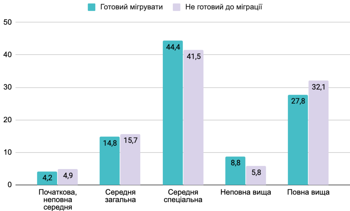
Рис.3.1 Розподіл українців за рівнем освіти, які готові у найближчий рік мігрувати з метою заробітків, у відсотках за 2017 р.

та повною вищою освітою – 5,8% та 32,1% відповідно.