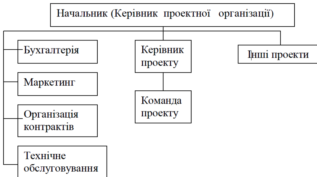
Рис. 4.1. Приклад проектної структури управління проектами

4) Організаційна структура. Принципова схема структури проектного управління представлена на рис. 4.1.