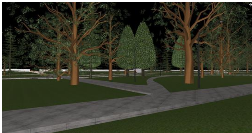
Рис.3. Вигляд парку з вул. Гойди