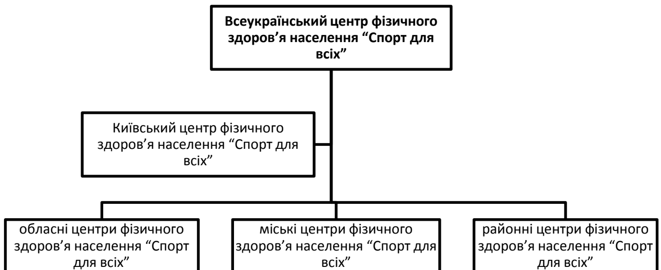
Рис. 6. Мережа центрів фізичного здоров'я населення "Спорт для всіх" в Україні