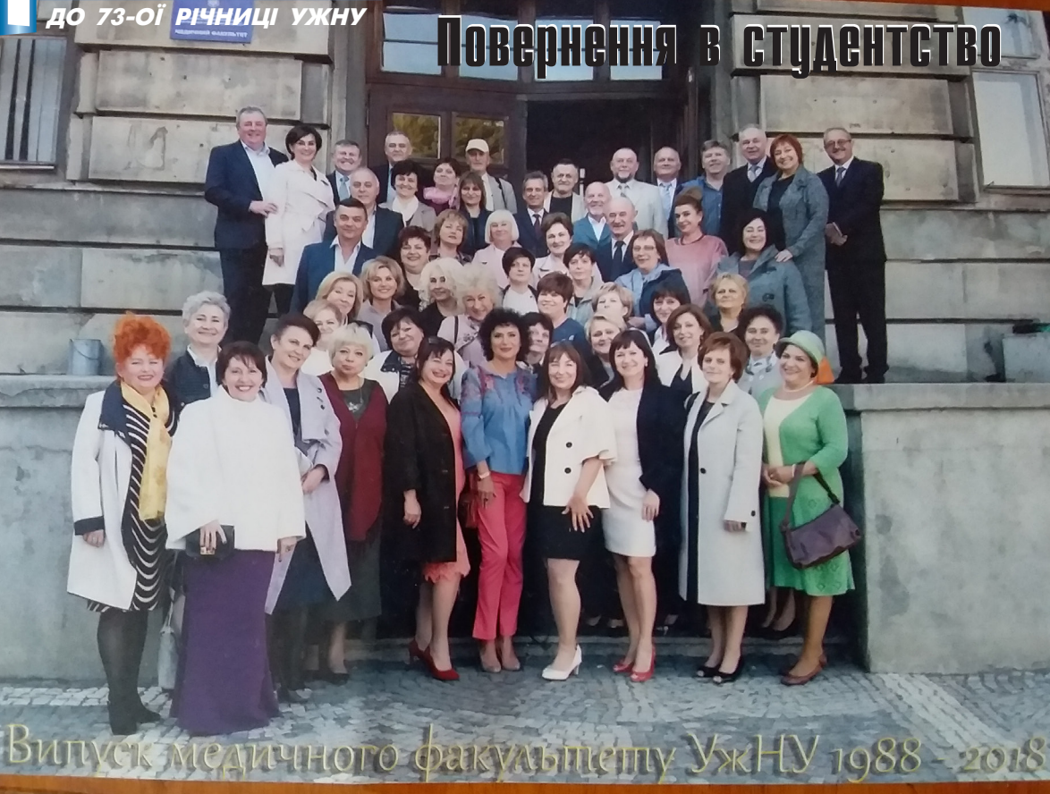
Випуск медичного факультету УжНУ 1988-2018

На медичному факультеті традиційними є зібрання випускників. Ось і цього разу з'їхалися ті, хто три десятиліття тому закінчив альма-матер.