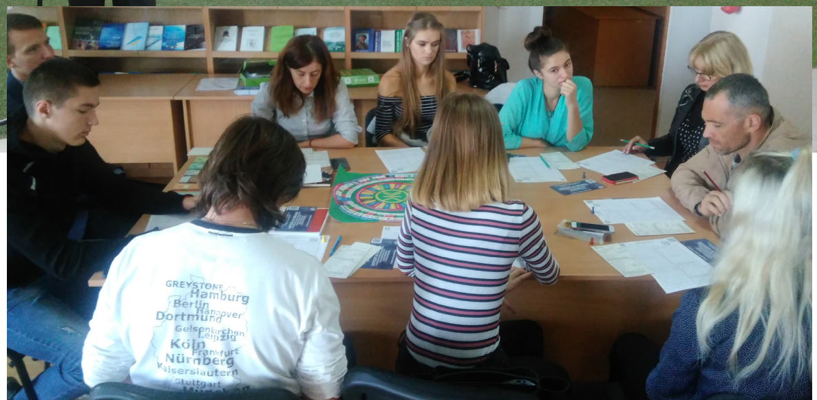
Студенти УжНУ та інші учасники тренінгу з фінансової грамотності

Крім офіційної, вітальної, частини, захід (до речі, відбувався в рамках проекту «Інформаційна підтримка молоді та мереж ЄС в Україні») передбачав і безкоштовні тренінги. Один із таких — щодо фінансової грамотності. Виявляється, указана тема неабияк зацікавила студентів. Захопливою розповіддю